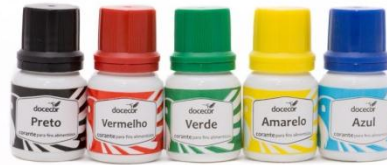
CORANTE ALIMENTÍCIO DE VARIADAS CORES;