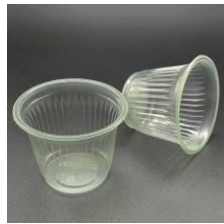
COPINHOS DE CAFÉ;